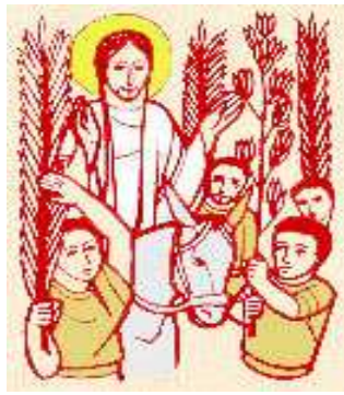
“Benedetto Colui che viene...”

Foglio Parr.le - 29 Marzo - 5 Aprile 2015 - Domenica delle Palme- Lit. Ore: 2 a Settimana -