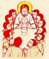
“Questo è il..”

ore 16.15: Confessioni 3 a - 4 a Elementare -